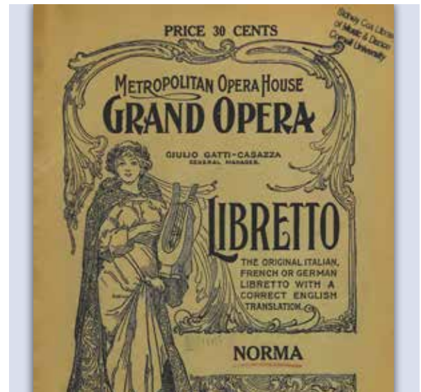
Libretto to the opera Norma by Vincenzo Bellini and Felice Romani Libreto de la ópera Norma por Vincenzo Bellini y Felice Romani. (US-I ML50.B44 N8 1900)