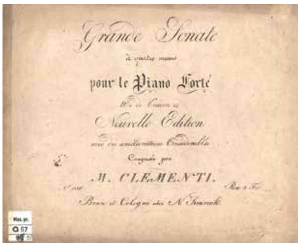
Edición impresa de la Sonata Grande para cuatro manos de Muzio Clementi, publicada en 1817 por Simrock, Bonn (D-F Mus. pr. Q 67/98) Printed edition of Muzio Clementi's Grande Sonate for four hands, published ca. 1817 by Simrock, Bonn